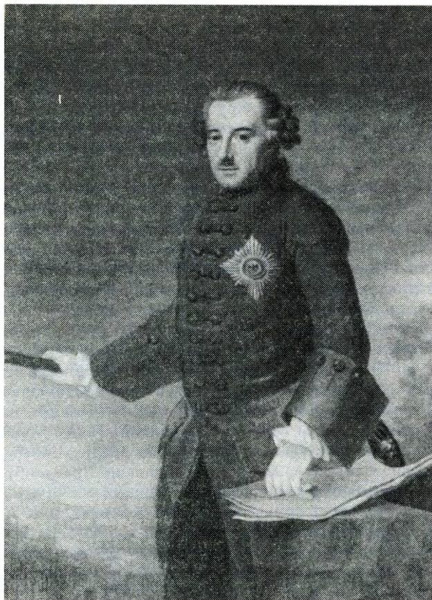
Король Пруссии Фридрих II (около 1763 г.). С портрета И.Г. Цизениса

увеличении государства". Так как прусские владения очень раздроблены, следует прежде всего стремиться к тому, чтобы "восстановить более тесную связь между частями страны или вновь присоединить к ней оторванные куски, которые, собственно говоря, относятся к прусским владениям". "Так Польская Пруссия искони принадлежала Пруссии, однако вследствие войн поляков с Тевтонским рыцарским орденом, ее тогдашним владельцем, была отколота. От провинции Пруссии Польская Пруссия отделена только Вислой. На Западе она примыкает к Восточной Померании. На Севере ее границу образует море и на Юге – Польша. Если однажды она будет принадлежать Пруссии, то этим не только приобретает свободная связь из Померании в Восточную Пруссию, но и возможность держать в узде поляков и предписывать им законы". Поляки могли продавать свои товары, только отправляя их вниз по Висле и Прегелю, а для этого потребовалось бы согласие Пруссии.