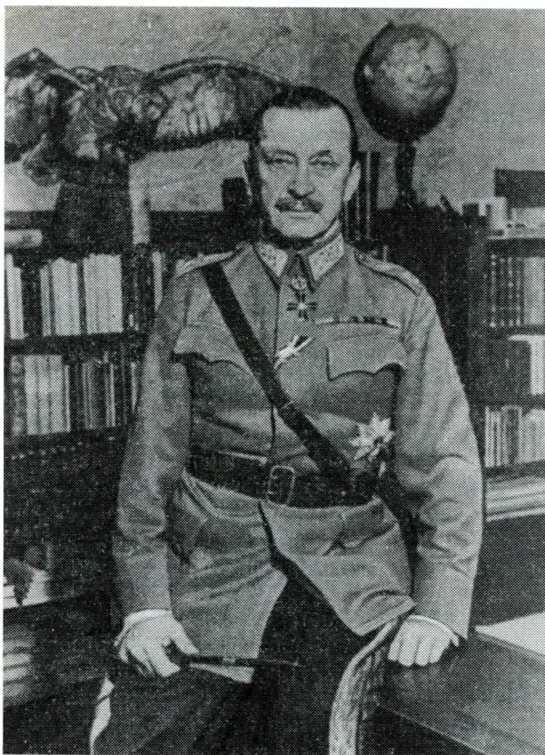
Карл Густав Эмиль Маннергейм