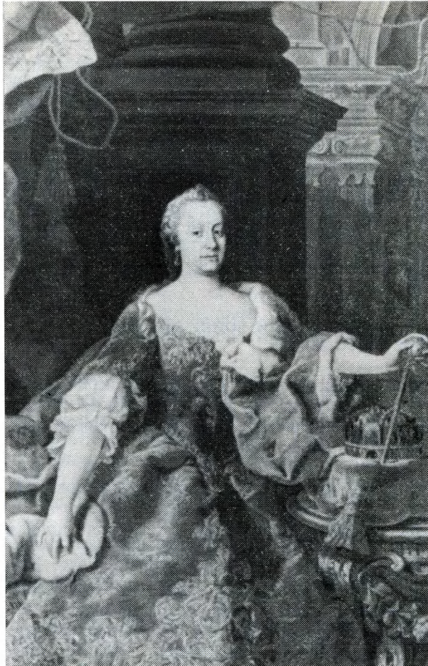
Мария-Терезия, королева Венгрии и Богемии, эрцгерцогиня Австрии, супруга императора Священной Римской империи Франца I. С портрета работы М. ван Мютенса-младшего.

только главным объектом своих экспансионистских вожделений – Саксонией, но и Польской Пруссией. Вторжение в Саксонию в августе 1756 г. Фридрих II оправдывал главным образом происками Венского двора, подобно Пруссии и другим странам проводившего военные приготовления. Однако, узнав через шпионов, что Австрия еще не завершила свои вооружения, Фридрих II в проекте "Манифеста против Австрии" объяснял предпринятую им агрессию так: "нападающим является не тот, кто производит первый выстрел, но тот, кто вынашивает план атаковать своего соседа и открыто проявляет это своей угрожающей позицией" 56 .